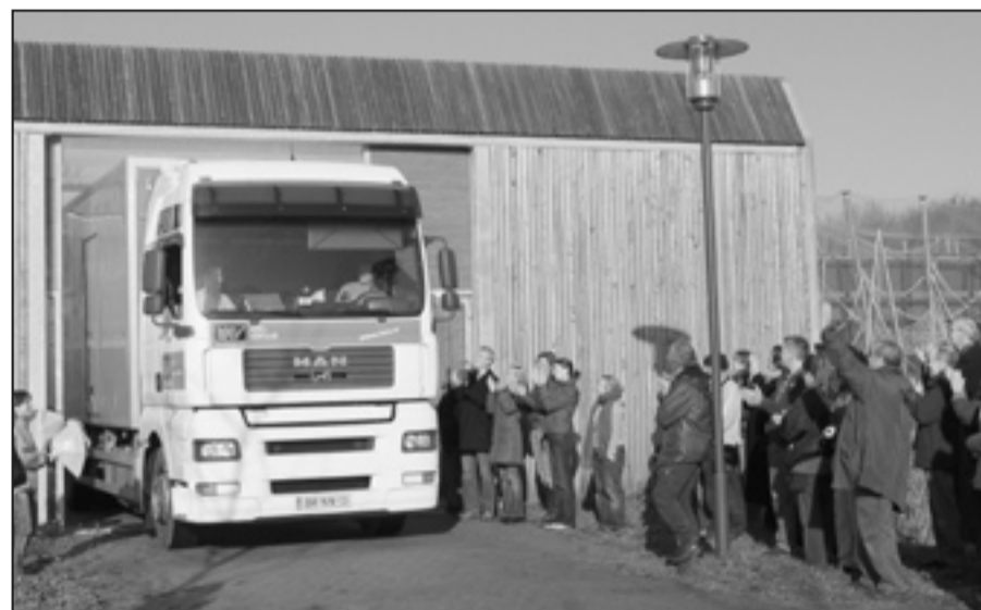
De KAV-vrachtwagen komt aan bij het Chimpanseecomplex

Het is zo'n 2.200 kilometer rijden naar Primadomus in Villena. Onderweg zijn er tal van voorschriften waar grote vrachtwagens rekening mee moeten houden,