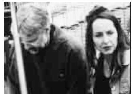
Dankzij het televisieprogramma 'De Uitdaging' van Angela Groothuizen, kon in 1996 onze tropische kas gebouwd worden